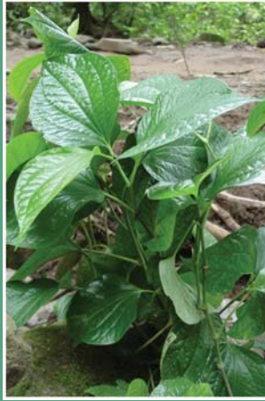
၃၈. ပူလံးစီး