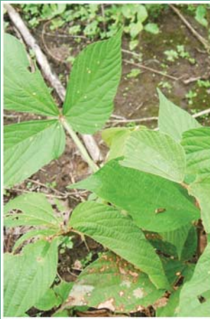
၈၈. ဒံးဒူးဘီ