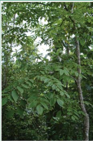
၁၆. လီဉ်ထူဉ်