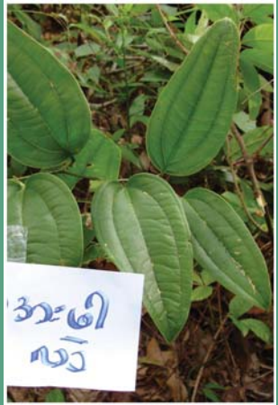
၁၀၈. ဟိဉ်ကအးဖါးဗဲ