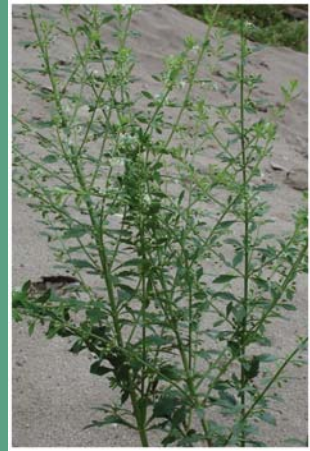
၂၄. နိုင်မိပြဲ