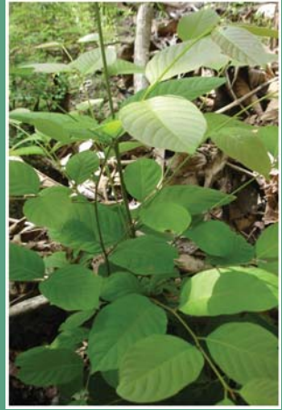
၁၁၇. မးနးထုဉ်