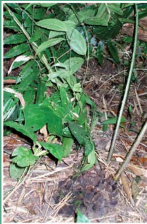
၉၅. ဒိန်ဂုာ်ခိန်