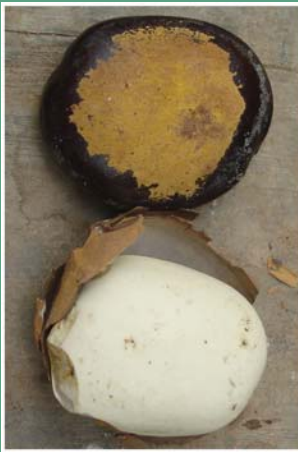
၂၈. မိကဲသဉ်