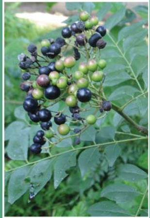
၇၂. သုဉ်ဆီအုဉ်