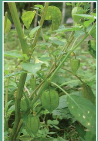
၇၈. ဆံးပိလိ