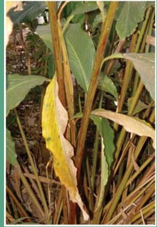
၅၇. ပိဏ္ဍားဆုံ