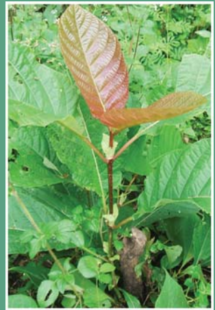
၁၀၂. ဖိခိဉ်စီ