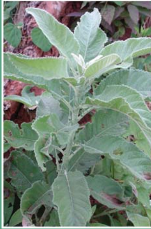
၈. ဖိပှ်လင် (ဖိနါ)