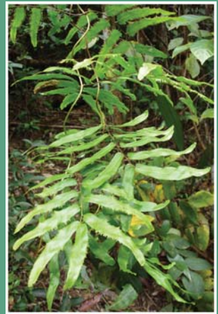
၁၁၄. ကံကူာ်ဖိးဗု