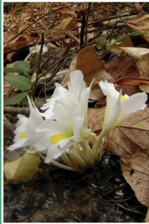
၁၀၇. ဖိာ်ဖိဝါ