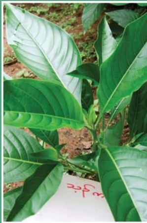
၁၀၁. သုဉ်ကဉ်စု