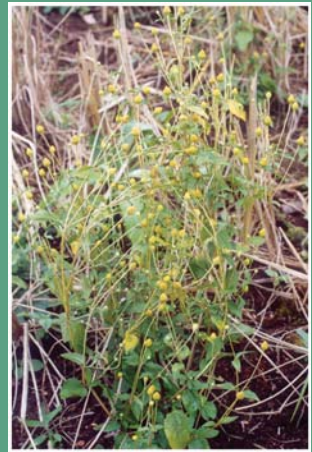
၆၀. နိုဗ်တားခိး