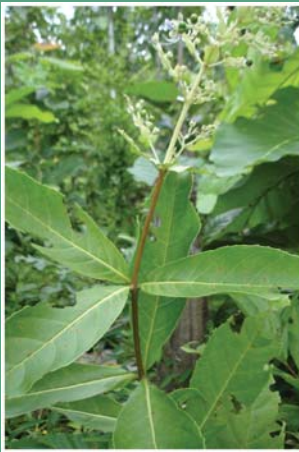
၃၄. ခွံင်အိစိ