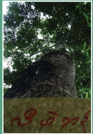
၄၂. လီဖဲထုဂ်