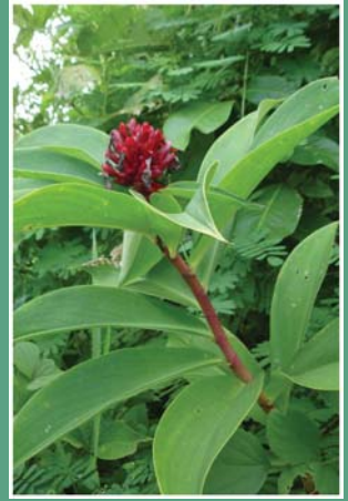
၆၃. သူလှားတံ