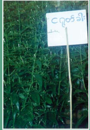
၃. မိုက်ခတ်