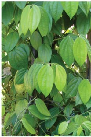
၄. မိုက်ခတ်