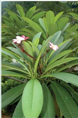
၁၀. ဖိဘိင်အုင် (ဖိဒိုင်ဖု, ဖိစိပလ)