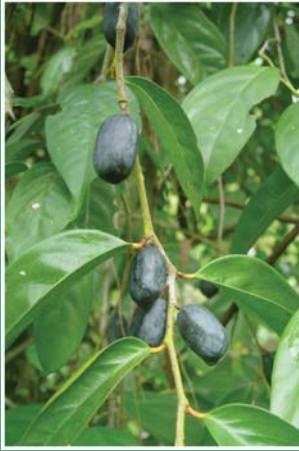
၃၁. သုန်တော်ကွဲ