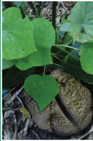
၈၉. ထွံဉ်ကဖုသဉ် (သဉ်လှိုတံာ်)