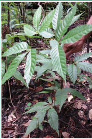
၉၄. လင်ဖးဒု