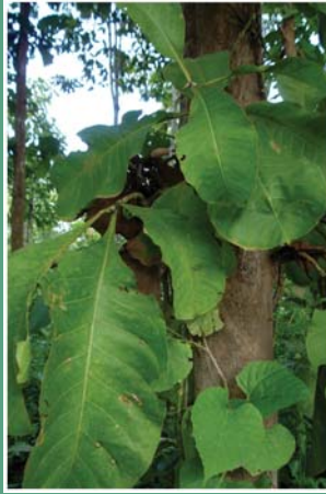
၉၈. မကွံင်လဉ်