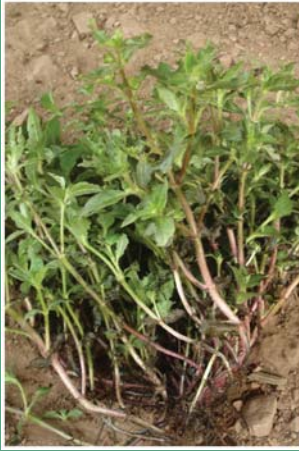
၅၅. နိုဗ်တားသူ