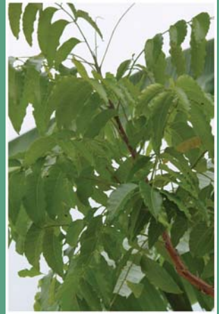
၉၀. တမာ်လဉ်