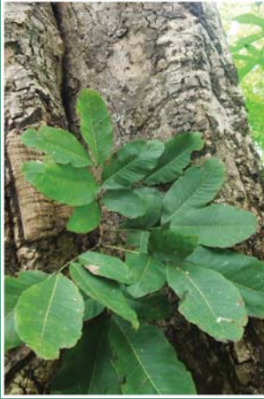
၃၇. သင်္ကတံး