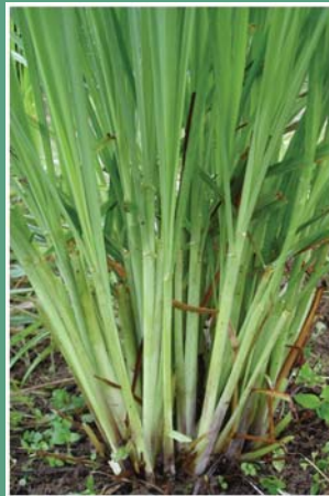
၁၁၉. နီဉ်ဝီၤတပိၤဝါ