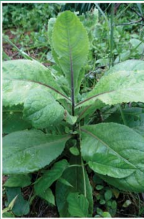
၁၀၀. နိုင်မဲလီ