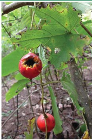
၆၄. စီးဝန်စားသန် (တဖိဂီ)