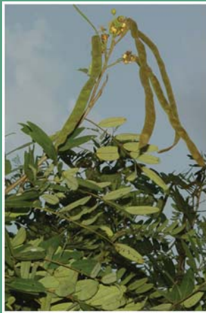
၂၉. ပံင်တခး