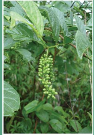
၉၉. နိုင်ဆုဉ်သဉ်