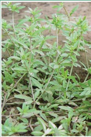
၄၆. တၢ်ခၢ်ဒီး