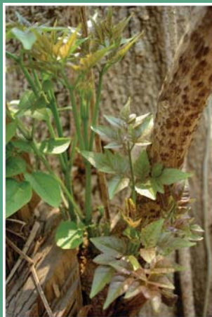
၇၉. အုတ်ကရံး