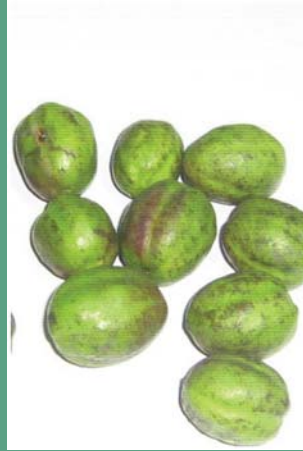
၂. မးနာသတ်