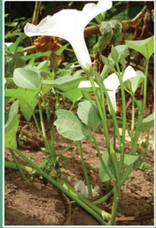
၉၃. ကီဝိနီနီ