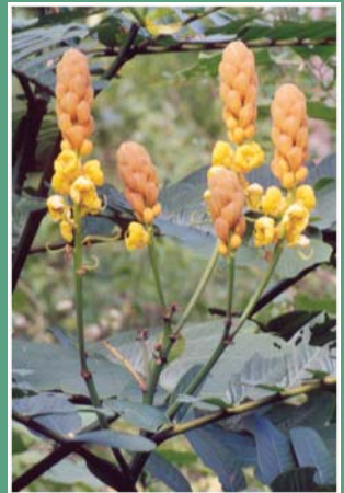
၁၈. ကသံဉ်ဖီလဉ်