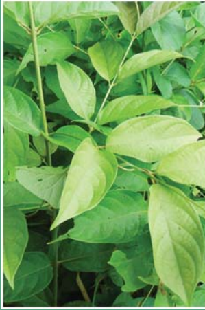
၁၀၃. ဖျိုဝါမှို