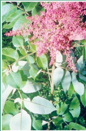
၄၇. တဆံၣ်သၢ်