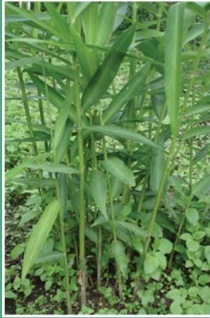
၁၄. နီဉ်ဃုဉ်