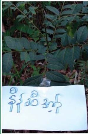
၇၁. နိုဉ်ဆီအုဉ်