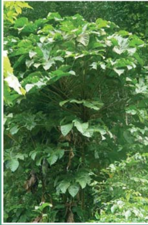
၅၀. ကုလိထုပ်