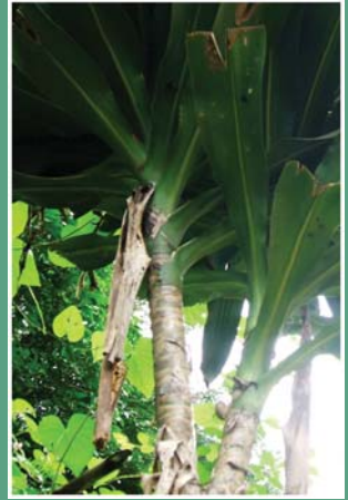
၁၅. ကီးလွာ်ဂီၤ