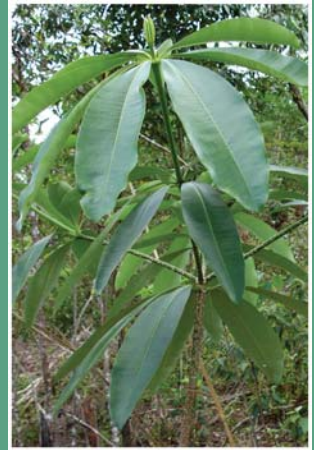
၆. နိုထုတ်