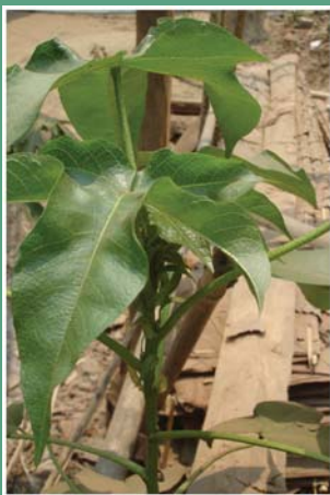
၈၄. ဘဲသုဉ်