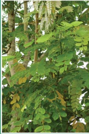
၆၈. စုဘီထွဉ်