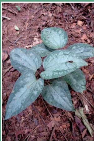
၈၃. စီလီဒဉ်အါဂီၤ