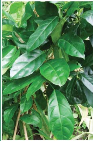
၁၁. တာဖးဒိုင်မိ