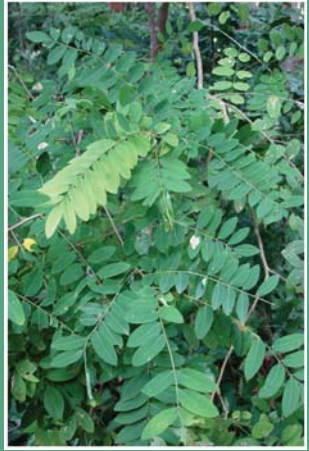
၁၀၅. ငါထူဉ်