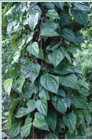
၁၁၂. သဘျူဉ်လဉ်