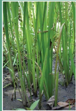
၃၆. လှနုန်