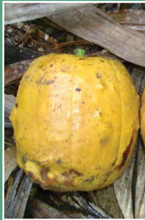
၅၉. သင်္ကါင်ကုံ