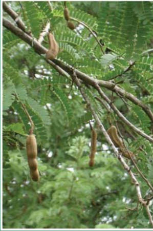
၄၃. သင်္ဃါကျော (စိၤကျိၣ်)