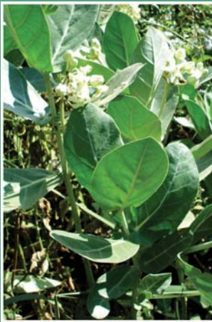
၄၀. သုဂ်ပန်နိုထံ