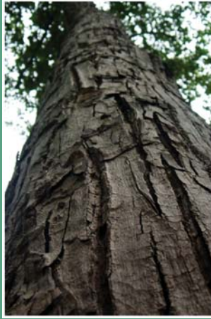
၁၀၄. သွန်ဖည်ဆါ