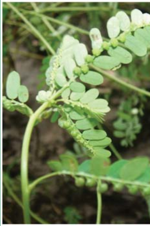
၂၂. နိုင်တယာမိ