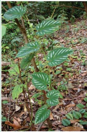
၁၀၆. ကသံဉ်ဒးဘီ