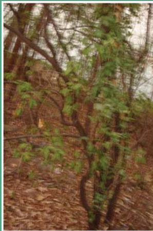
၁၇. ကလီဂီၤ