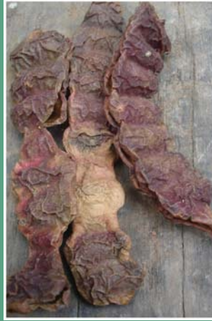
၁၁၆. ဖိဆံဉ်သဉ်