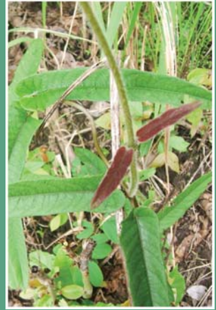
၁၁၁. ထွံဉ်နာအုဉ်မုာ်