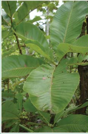
၉၇. ဗီဒိုထူဉ်