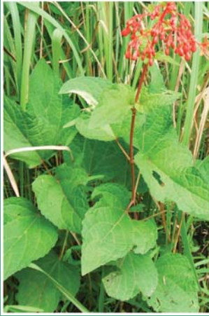
၆၇. ဖိကွါးဂီၤ