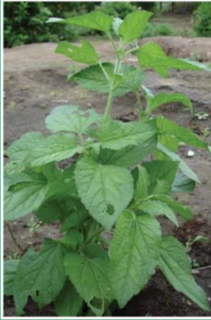
၈၅. နိင်နာသံ