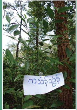
၅၁. ကသံဉ်သွံဉ်