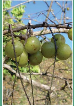
၃၉. တယးသင်္ဂ