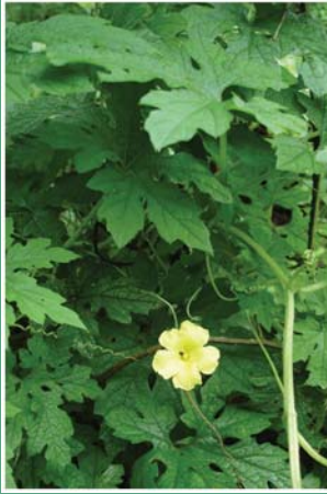
၁၃. သီခါလဉ်