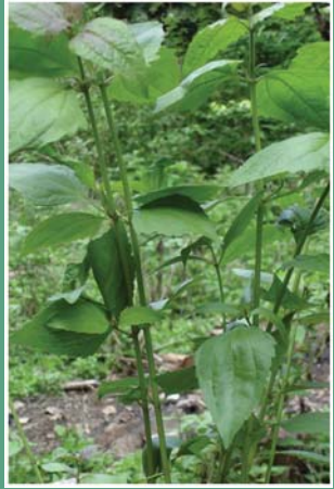
၄၅. ဆံးဖိက္ခ