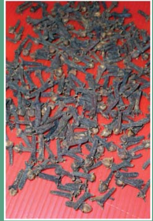
၂၇. လုညဉ်ဖီ