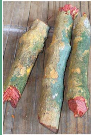
၅. ဗံထံ (နီတိယ)