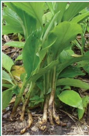
၆၅. ပိတ်တရီ