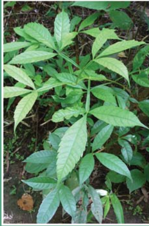
၉၂. ပတီဝါလင်္ဂ