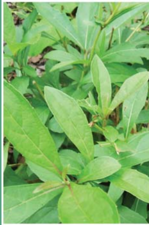
၅၃. နိုင်မိလါ