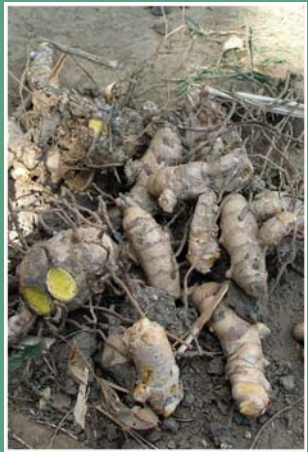
၄၈. တယီၣ်ခၢ်