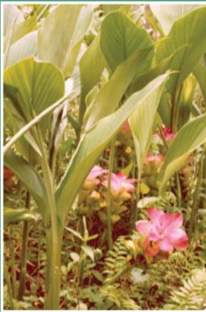
၅၈. ပိဏ္ဍားခိး