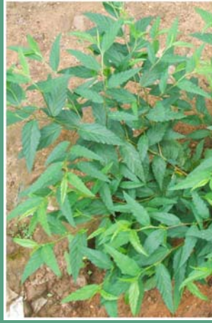
၂၀. နိုင်ဗျာမဲ