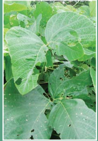
၈၇. ပျံယုဂ်ခို