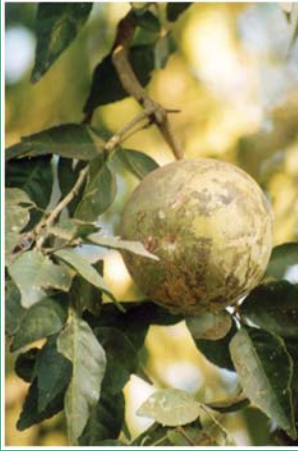
၂၅. မးပံင်သဉ်