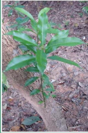
၁၁၀. နိဖါး