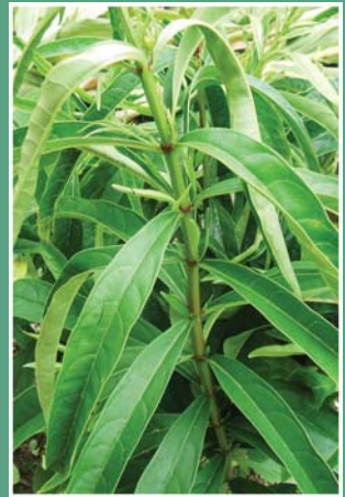
၆၆. ဘီနိုက်ထီးထား