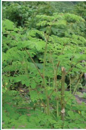
၆၂. သုန်ဖိစီး (အေးသလျှင်ဖိစီး, ပထီးသုန်)