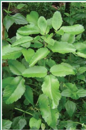
၇၇. သုန်လန်ကဲ