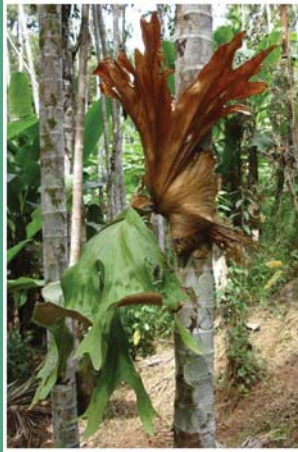
၇၄. ကဆီဝါနံ