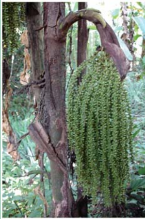
၇၀. ကယဲၤထွဉ်