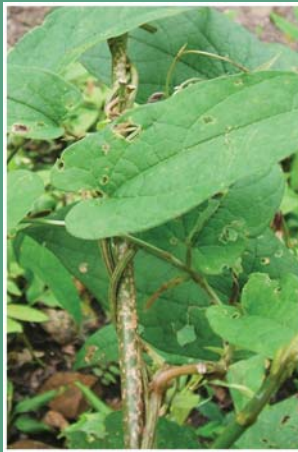
၄၁. တဒီးသီ