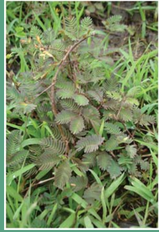
၂၁. နိုင်မံခွ (နိုင်မံချဉ်)