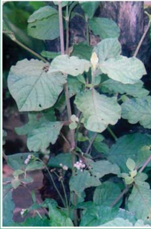
၄၉. ကိုတမူဂီ