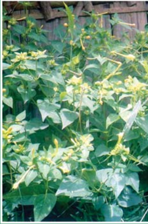
၁၁၅. ဖိမုန်ဟါ