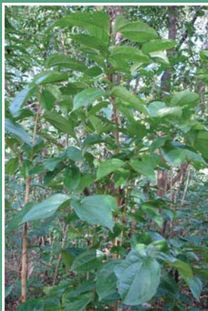
၈၀. ကျေးအုတ်ထူဉ်