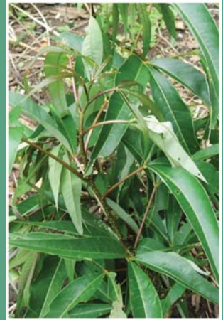
၅၄. နိုင်ထေးဒီး (ဟိုင်ထေးဒီး)