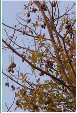
၆၉. တဖံဉ်ထွဉ်