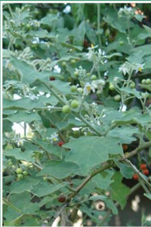
၁၁၈. တကီၤခဉ်မိ