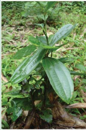
၅၂. ကီးလှ်ထုပ်