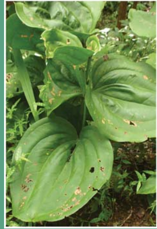
၃၃. ဟိန်ကအး