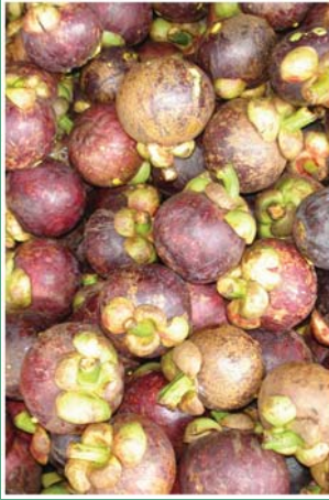
၁၉. မဲကျားသင်္ဃန်း