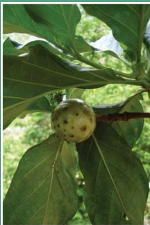
၈၁. ယဲယီၤသဉ်