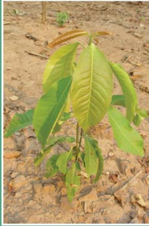
၂၆. ကဝဉ်ဝါ