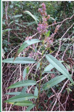
၂၃. နိုင်ကီးဘိုင် (ကိဂီထွဉ်)