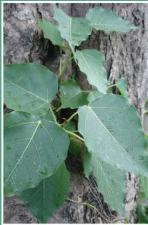
၁၁၃. ချဉ်ဖိ