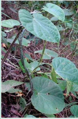
၁. လီတလူးမှို (မရိုကတီ)