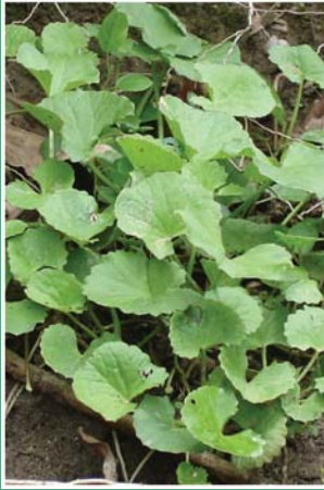
၁၀၉. ကသွန်ခိဉ်မုဉ်ဖိး