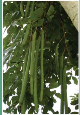
၇၅. ကယီဝါသံ