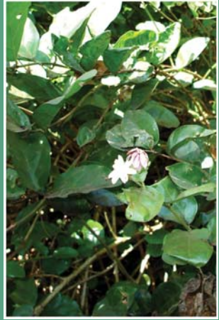
၉. ဖိနွံကဘျံး (ဖိစဘင်)