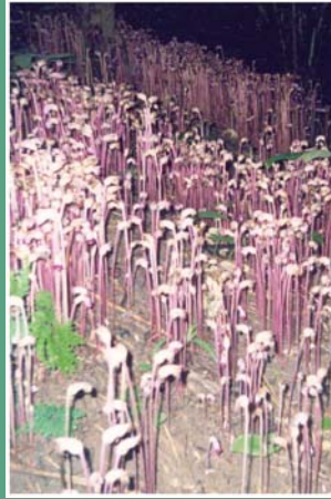
၃၂. မိတ်တိစု