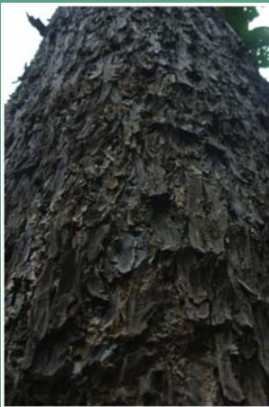
၇၆. တနူထွန်