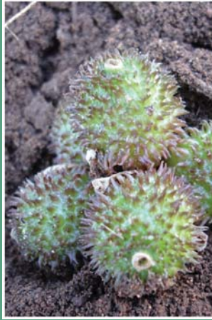
၈၆. မးအံးသဉ်