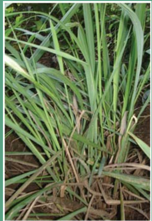
၁၂၀. နီဉ်ဝီၤတပိၤဝါ