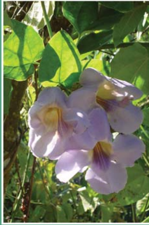
၄၄. စိလိၣ်အါဝါ