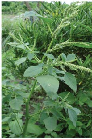
၇၃. ကမ္ဘာလီမံ