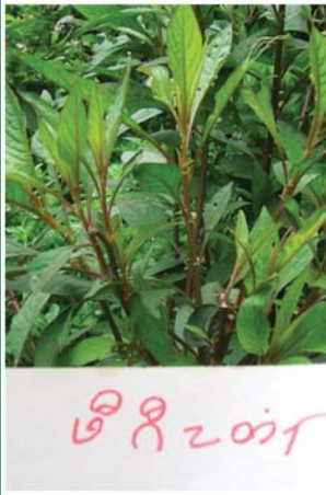
၆၁. ဖိရိတ်တံ